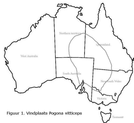
Figuur 1. Vindplaats Pogona vitticeps

P. vitticeps komt alleen voor in Australië, in gebieden in Queensland, New South Wales, Victoria, South Australia en het Northern Territory (zie figuur 1). Je treft ze aan in droge en half woestijnachtige gebieden en in open bossen. Baardagamen hebben verschillende kleuren in het wild, afhankelijk van waar ze voorkomen. In gevangenschap worden verschillende kleurslagen (morphs) gekweekt, van bijna wit tot donkerrood.