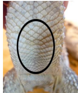
Figuur 2. Vrouw