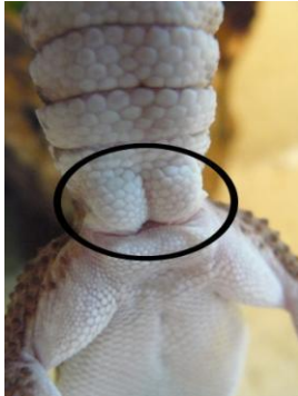
Figuur 1. Man

Het geslachtsonderscheid bij Hemitheconyx caudicinctus is niet moeilijk te zien. Bij de man zie je duidelijk twee "ballen" aan de basis van de staart (figuur 1). Hierin bevinden zich de hemipenes. De vrouw heeft deze nauwelijks of niet (figuur 2).