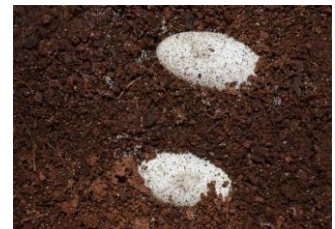
Eieren in cocopeat

Bij deze temperatuur komen de eieren na 60 tot 70 dagen uit.