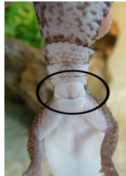
Figuur 2. Vrouw